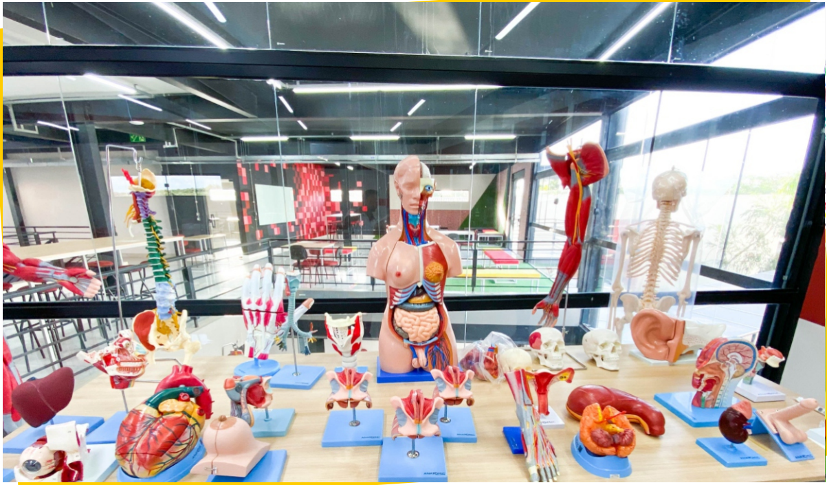
Laboratório de Anatomofologia - Bloco da Saúde