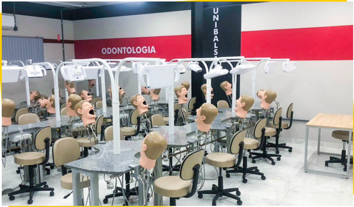
Pré-Clínica - Bloco da Saúde