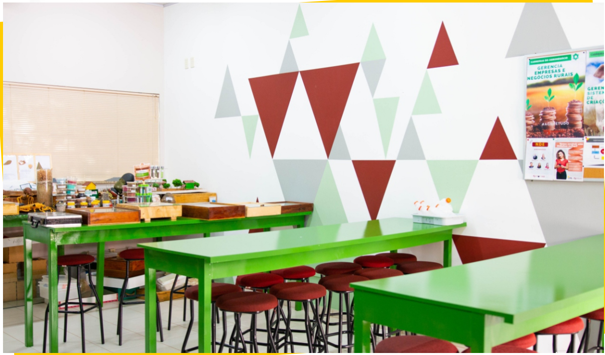
Laboratório de Agronegócio - Bloco C