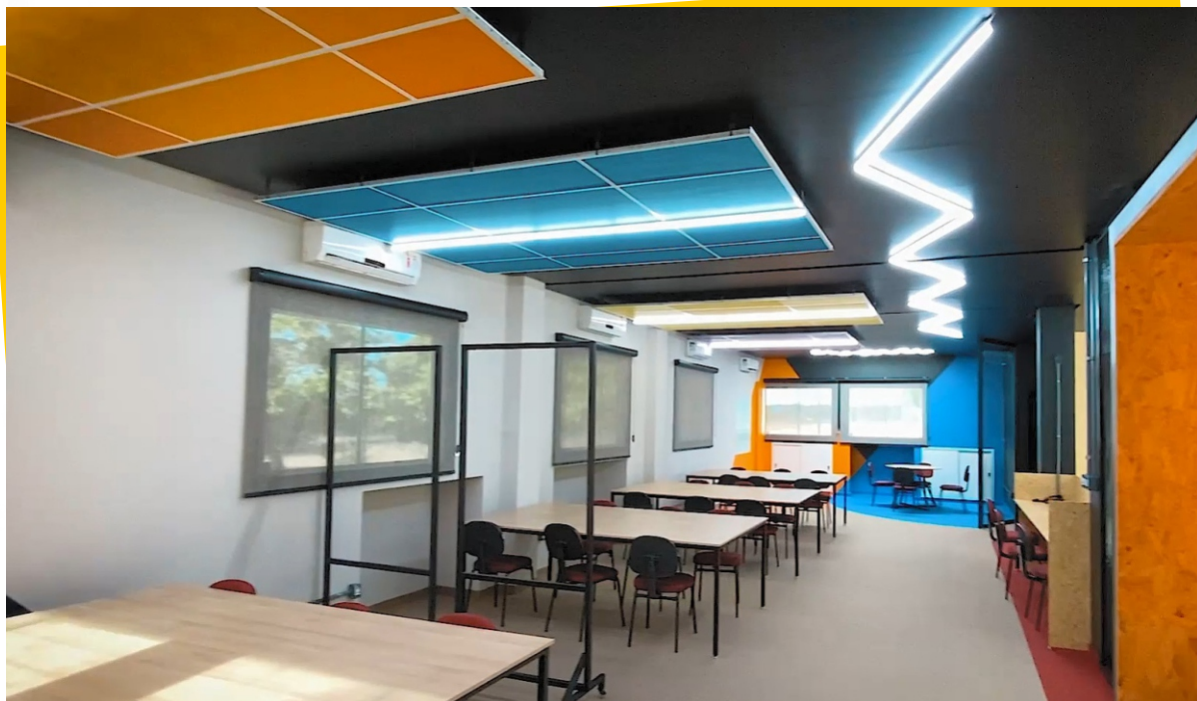
Agência de Inovação e Empreendedorismo

Além desses, a Unibalsas possui outros laboratórios com estrutura, materiais e equipamentos atualizados e inovadores, onde os estudantes aperfeiçoam as práticas específicas dos seus cursos.