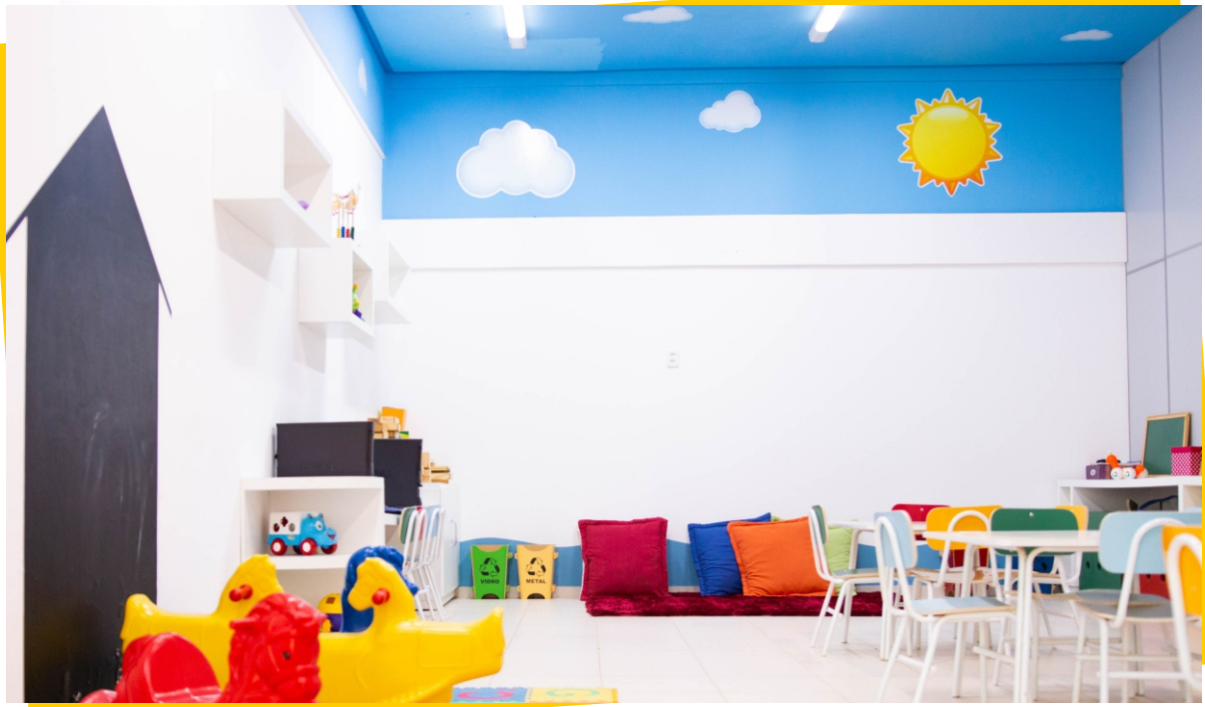
Brinquedoteca - Bloco B