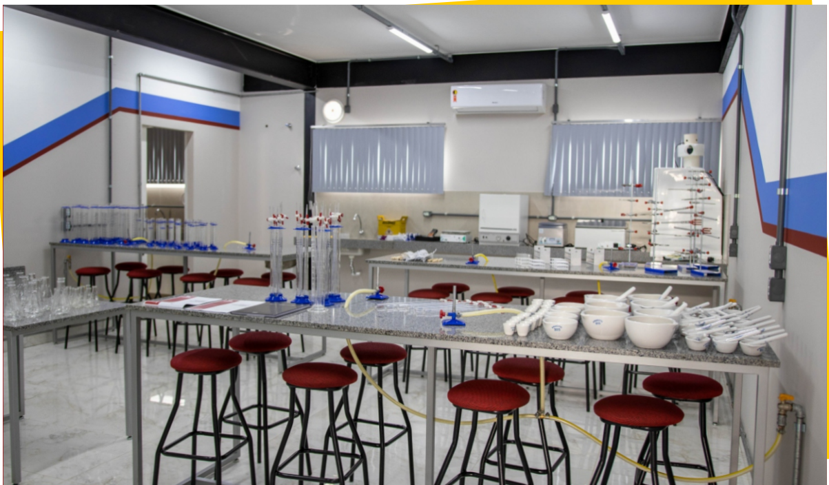
Laboratórios Multifuncionais - Bloco da Saúde