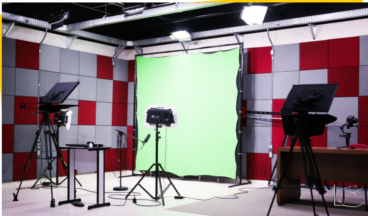
Laboratório de TV - Bloco A