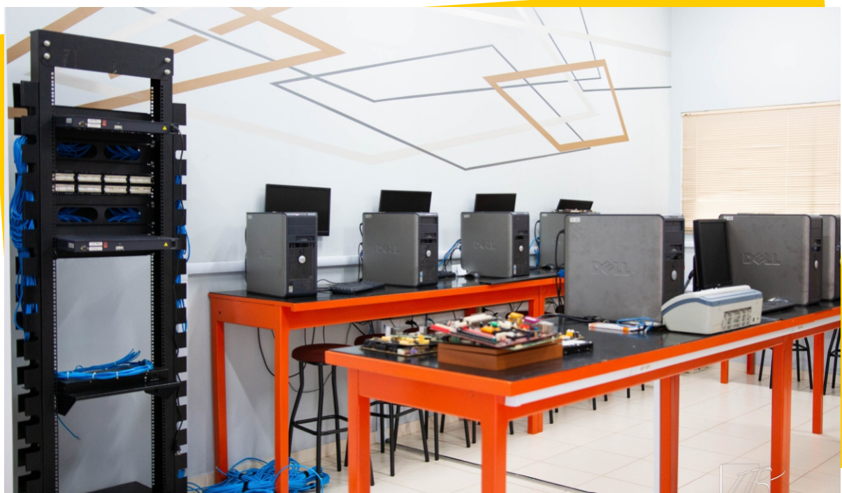
Laboratório de Redes e Hardware - Bloco C