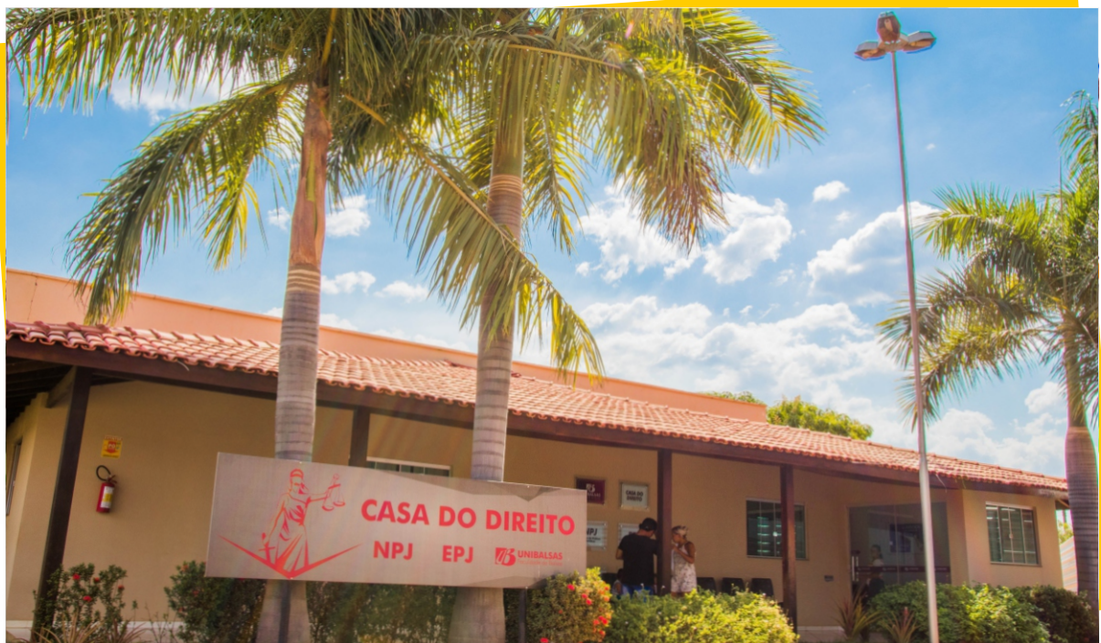
Laboratório de Prática Jurídica - Casa do Direito