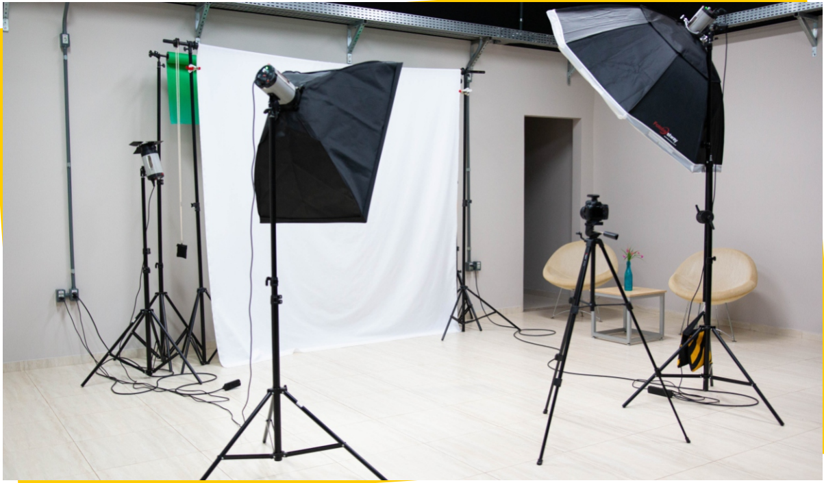
Laboratório de Fotografia - Bloco A