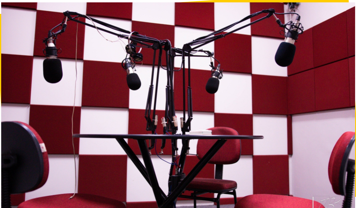
Laboratório de Rádio - Bloco A